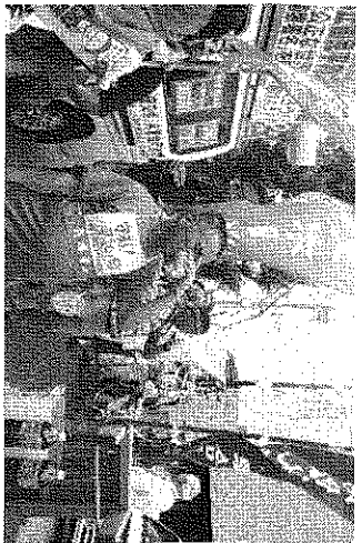
原水爆禁止被爆者救済を求める国民平和行進が「応急危険度判定」で「危険」と判定し建物の壁に「危険」と書かれた赤色のステッカーが貼られ、6月22日に家主からは「倒壊の危険を示す赤紙が貼られ危険なので即時建物から避難して

ください。避難先は各自でして下さい」 と文書で通知して来ました。 1、入居者8世帯の内、3名が組合に相談にきました 2、尼崎市内の北部にあたる下坂部地域から地震により一部に壊れ「家主から修理はしない」「借家を明渡せ」と言ってきた。 ここに住んでいる